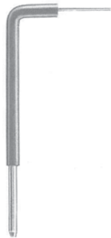
90.011.62 Fig. 62 90°

Schaft · shaft · tige vástago · asta Ø 4 mm